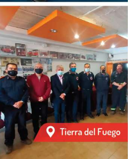
📍 Tierra del Fuego