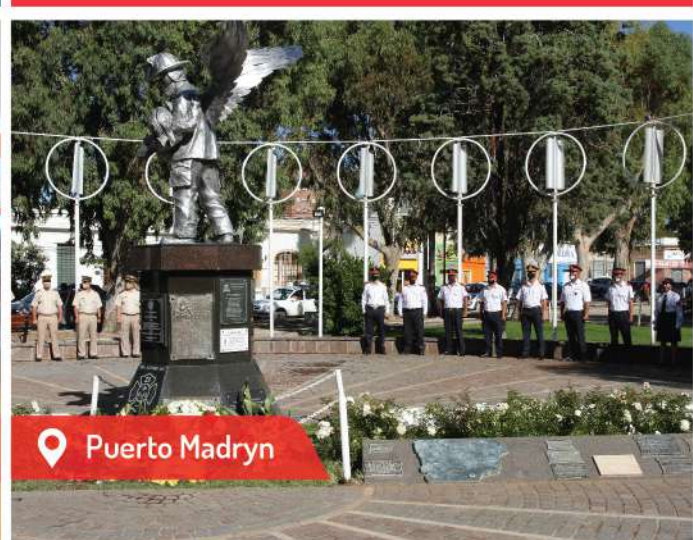
📍 Puerto Madryn