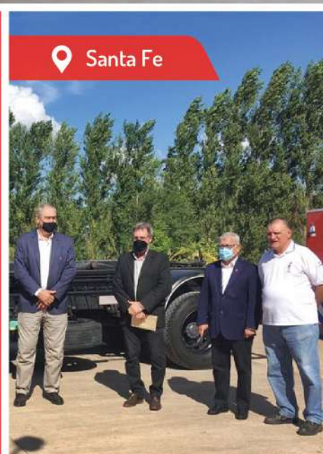
📍 Santa Fe