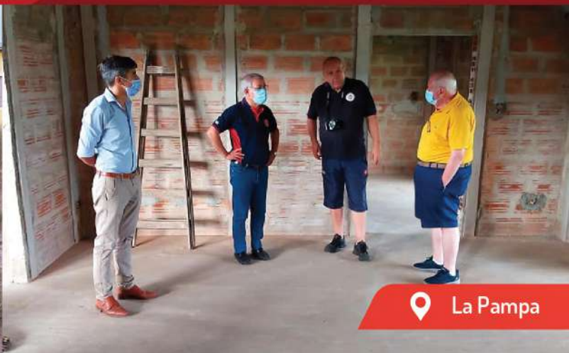
📍 La Pampa