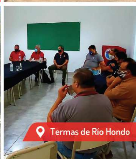
📍 Termas de Río Hondo