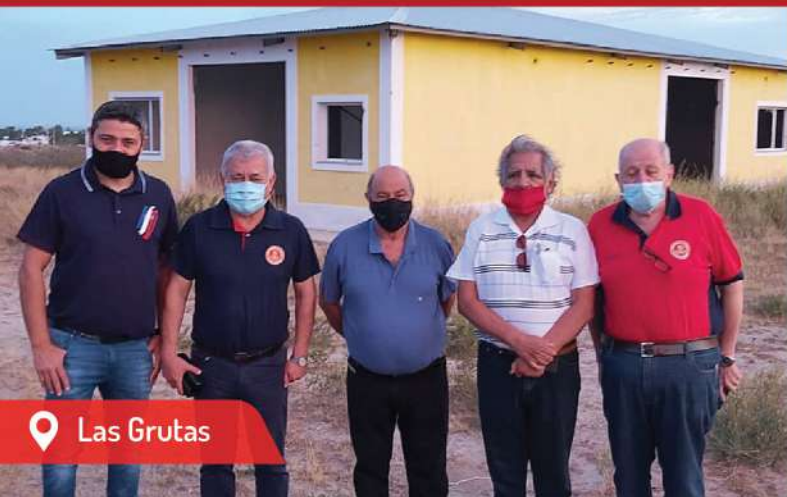
📍 Las Grutas